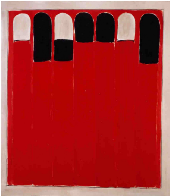
Penitentes rojos, 1972

ESTRATEGIAS CREATIVAS EN TORNO A GUERRERO Y LA ABSTRACCIÓN