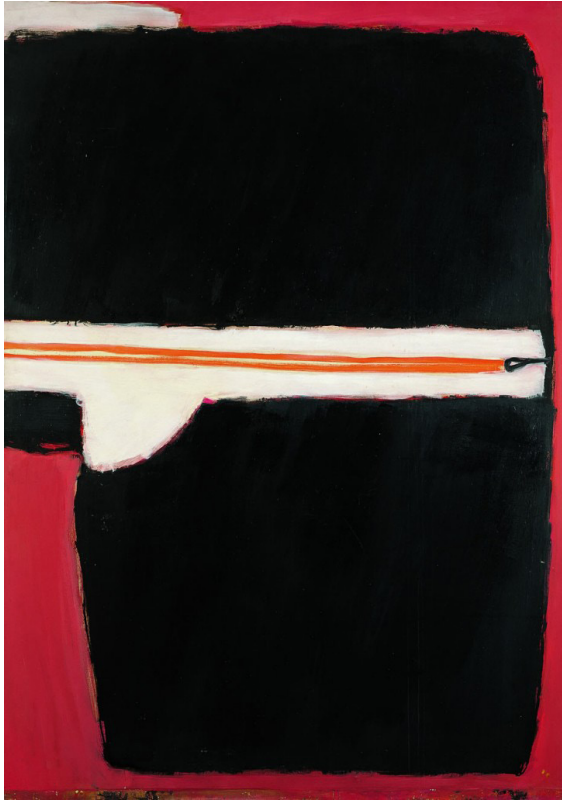
Presence of black, 1977 Óleo sobre lienzo, 179 x 126,5 cm

ESTRATEGIAS CREATIVAS EN TORNO A GUERRERO Y LA ABSTRACCIÓN